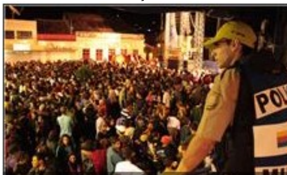
Policiamento foi elogiado pela comunidade

O comando da 8ª Companhia Independente da Polícia Militar (CIPM) garantiu a segurança da população que pôde curtir a 11ª edição da Festa da Renascença em Pesqueira, no Agreste Pernambucano.