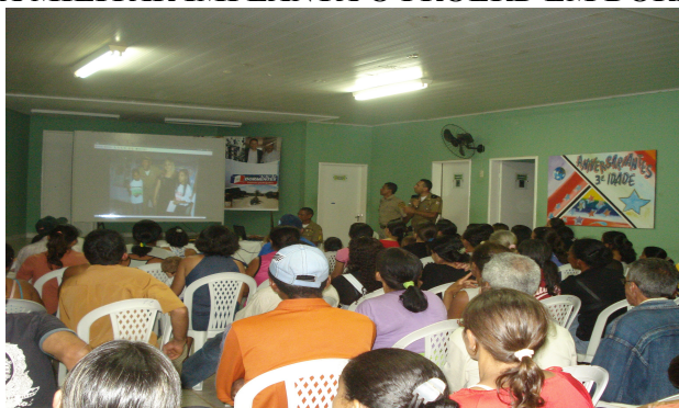
Curso iniciou na 2ª feira (25)

Desde a última segunda-feira (25), que está em andamento o curso do Programa Educacional de Resistência às Drogas e à Violência (PROERD) nas escolas do Município de Dormentes. A primeira atividade foi uma reunião de Pais no Centro de Convivência do Idoso (CCI).