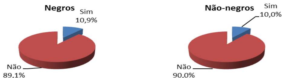
Gráfico 2 Distribuição de empreendedores (1), segundo ida a postos públicos de atendimento ao trabalhador enquanto iniciavam seu negócio ou empresa (por outros meios), por raça/cor Região Metropolitana do Recife Maio a outubro de 2008