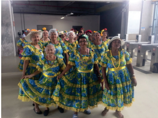
Idosos viveram momentos de descontração na Arena de Pernambuco, sob a coordenação da SDSCJ