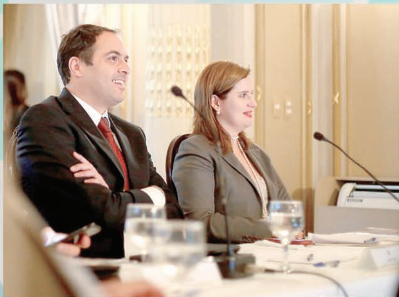
Paulo criou uma executiva que trabalha questões relacionadas às drogas

A frase é do governador Paulo Câmara, ressaltando q compromisso de montar uma estrutur