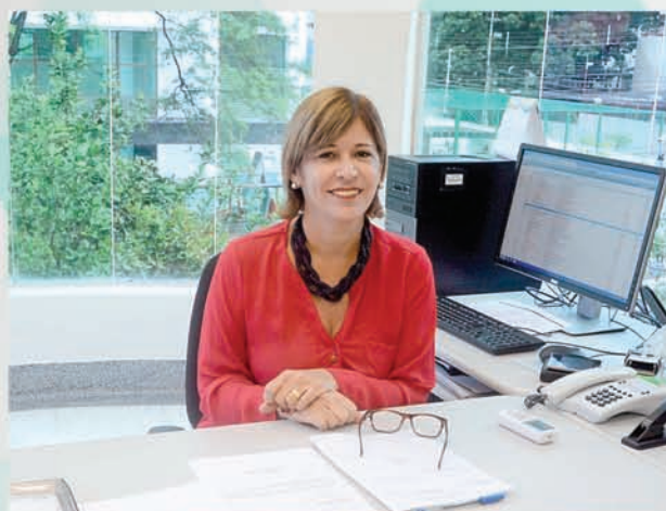
A capacitação dos técnicos da Assistência Social é prioridade para a executiva

Ampliando diálogo com municípios, executiva promove ações socioassistenciais