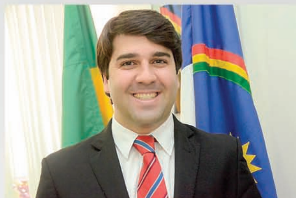
Entre as ações futuras, ampliação dos espaços de proteção