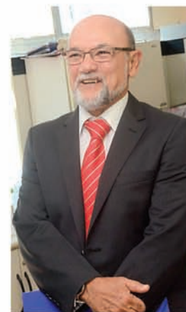
Regularização Fundiária da Prefeitura de Jaboatão dos Guararapes.