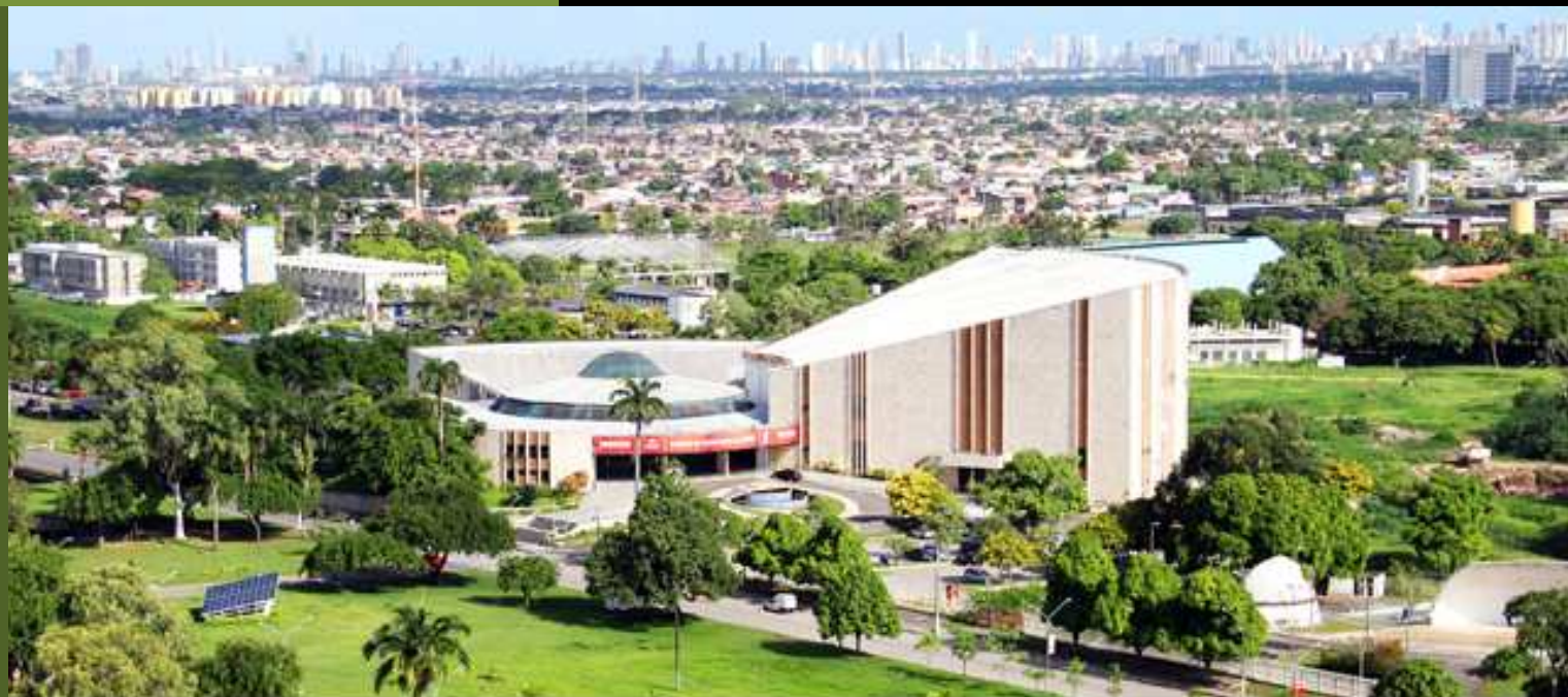
Centro de Convenções da UFPE.

A função da centralidade metropolitana potencializada nos eixos das BRs e PEs, a serem requalificadas como eixos urbanos da centralidade metropolitana.